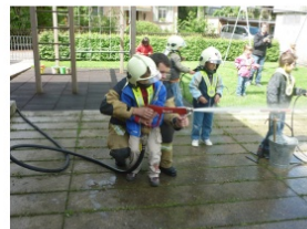
Auch andere Ausflüge machen wir hin und wieder. Sie werden jeweils im Voraus darüber informiert.