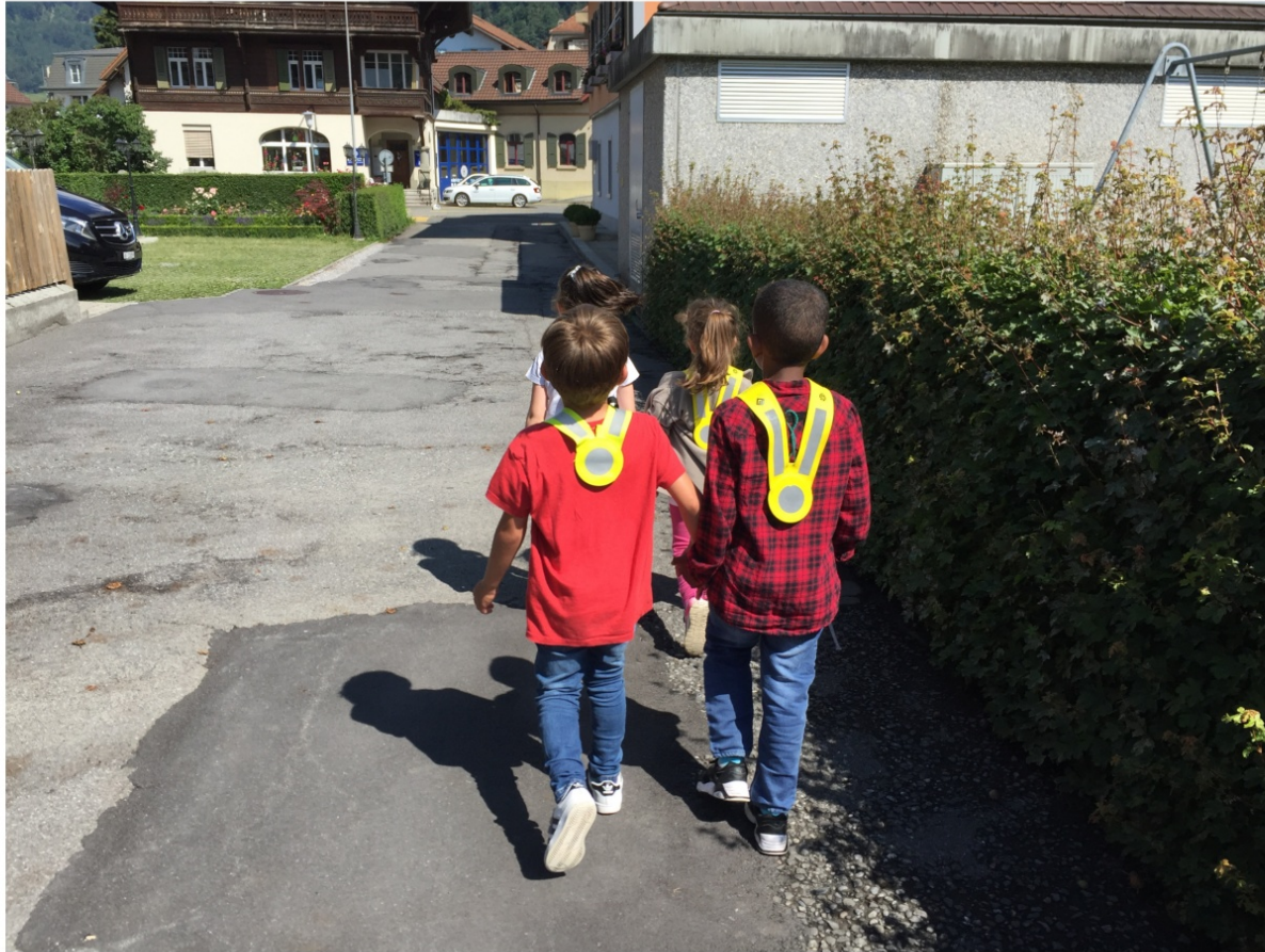
Die Kinder kommen zu Fuss in den Kindergarten. Dabei tragen sie den Leuchtgurt.