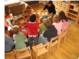
Wir treffen uns jeden Morgen im Kreis, spielen und arbeiten gemeinsam an einem Thema.