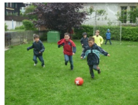
Wir verbringen viel Zeit draussen. Deshalb ist es wichtig, dass Ihr Kind dem Wetter angepasste Kleidung trägt. Die Kleider können beim Spielen, Malen und Basteln drückig werden.