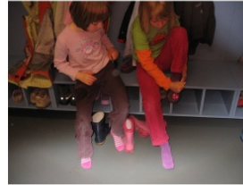
Die Kinder ziehen sich in der Garderobe selbstständig um. Am besten eignen sich geschlossene Finken.