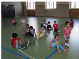
Einmal pro Woche gehen wir in die Turnhalle.