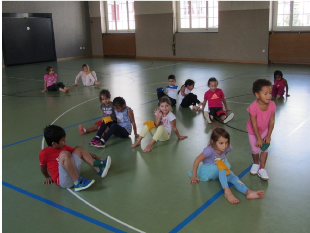
Einmal pro Woche gehen wir in die Turnhalle.