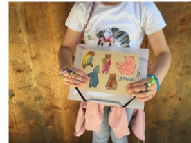
Am Ende des Morgens treffen wir uns wieder im Kreis. Schriftliche Informationen nimmt Ihr Kind mit der Briefpost nach hause.