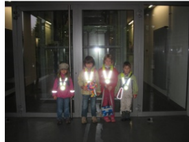
Die Kinder warten vor der Türe. Bitte schicken Sie Ihr Kind pünktlich. Melden Sie Ihr Kind ab, wenn es krank ist.