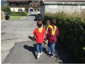
Die Kinder kommen zu Fuss in den Kindergarten. Dabei tragen sie den Leuchtgurt.