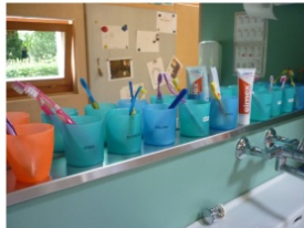
Ca. um 10:00 Uhr essen wir Znüni, es ist uns wichtig, dass die Kinder ein gesundes Znüni mitnehmen. Ausnahmen gibt es nur am Geburtsstag. Danach putzen wir uns die Zähne.