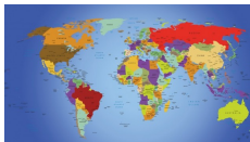
23 UNTERSCHIEDLICHE HERKUNFTSLÄNDER