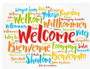
24 UNTERSCHIEDLICHE MUTTERSPRACHEN